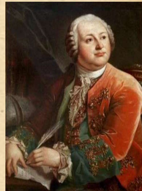
М.В. Ломоносов XVIII в. н.э.

Физика (греч. φύσις) – одна из основных наук о природе.